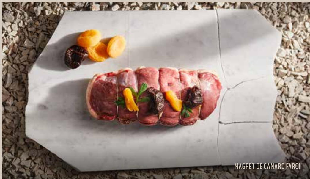
MAGRET DE CANARD FARCI

Épaule d'agneau désossée farcie de légumes, persil, ail, tomates séchées à l'huile et de tranches de jambon cru.