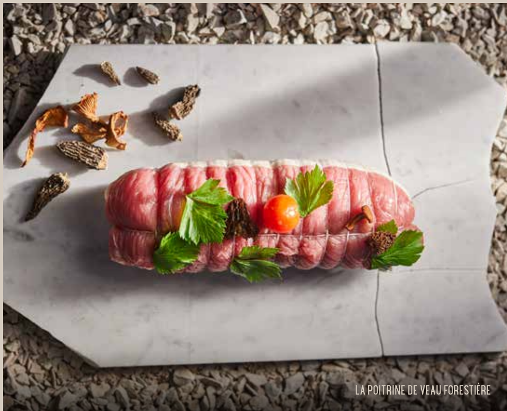
LA POITRINE DE VEAU FORESTIÈRE