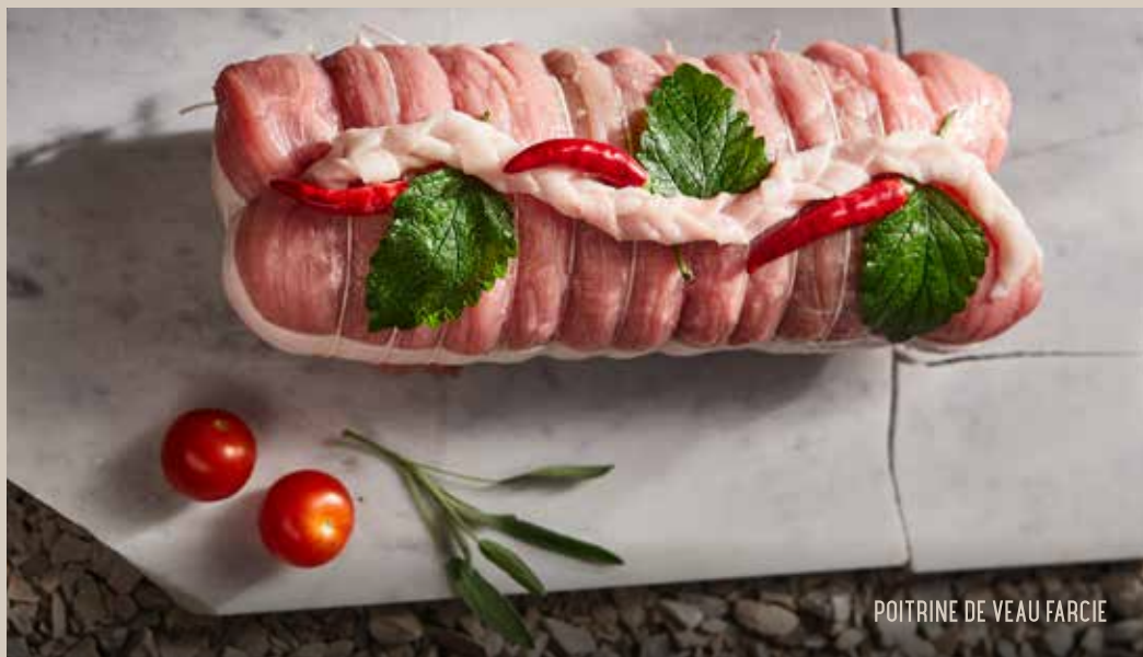
POITRINE DE VEAU FARCIE

Carré de veau désossé, emmenthal, jambon cuit braisé et fromage râpé.