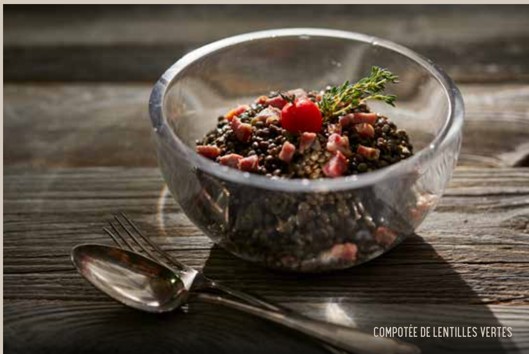
COMPOTÉE DE LENTILLES VERTES