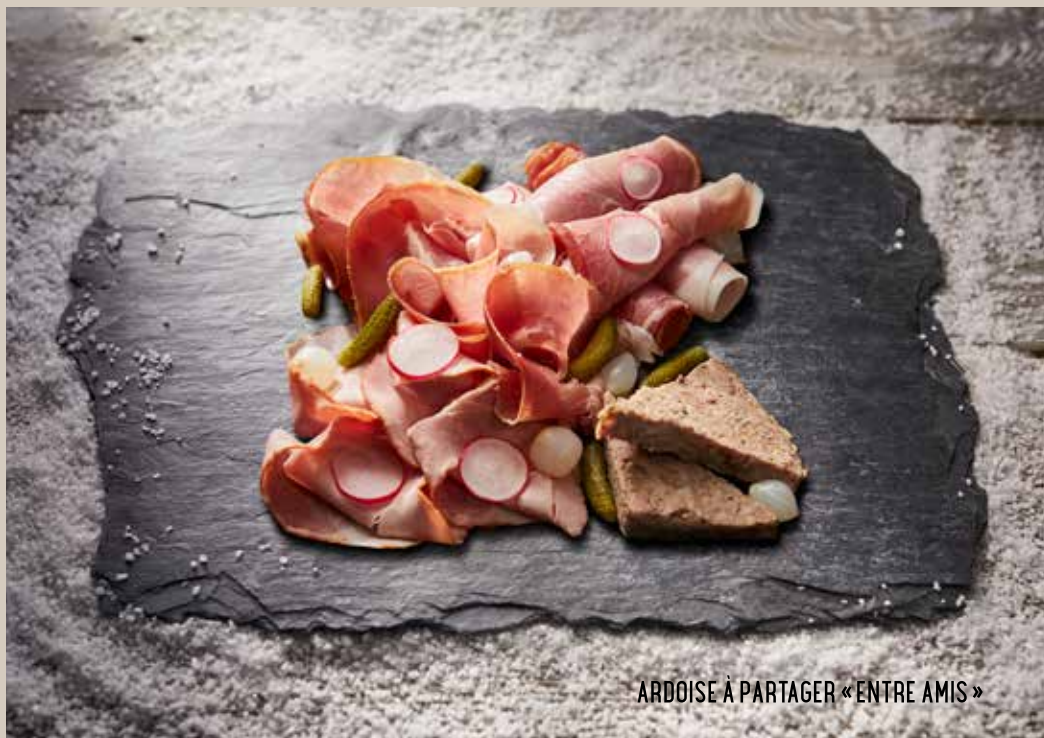
ARDOISE À PARTAGER «ENTRE AMIS»