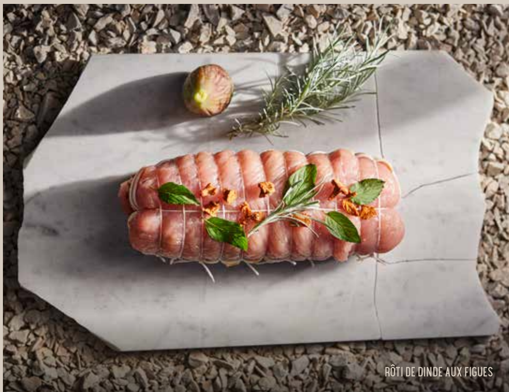
RÔTI DE DINDE AUX FIGUES