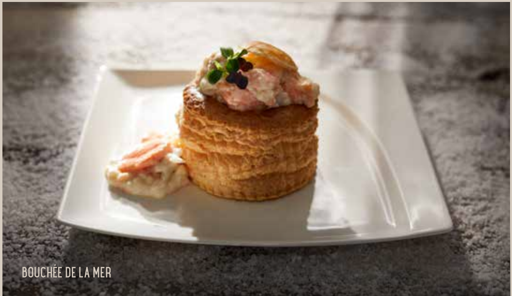
BOUCHÉE DE LA MER